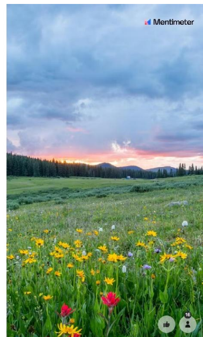
Abbildung 3 Ergebnis Umfrage IKQ 05.06.2024

Eventuell einhergehend mit der Angebotsdichte ist auch die Nachfrage an den vorhandenen Angeboten eine Herausforderung. Gemeint ist hier, dass es mitunter schwierig ist, genügend Teilnehmende für die stattfindenden Angebote zu mobilisieren. Ob die Gründe dafür in der Erreichbarkeit, der Motivation oder anderer Aspekte liegen, ist nicht zu bestimmen, da es dafür keine ausreichende Datenlage gibt. Im Forschungsprojekt KUMULUS wurde erhoben, welche Herausforderungen sich Träger kultureller Bildung in peripheren Räumen gegenübersehen. Häufig wurde dort auch die Ansprache der Zielgruppen und die Suche nach dem Personal